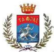
Comune di Taranto

CONSIGLIERA DI PARITÀ PROVINCIA DI TARANTO