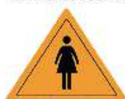
DONNE al LAVORO

CONSIGLIERA DI PARITÀ PROVINCIA DI TARANTO