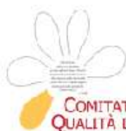
COMITATO PER LA QUALITÀ DELLA VITA